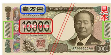
<新日本銀行券(表面)>

アラビア数字(赤色部分)を大きくしたり、指で触って券種の識別ができるマーク(黄緑色部分)を券種毎に異なる配置にするなど、分かりやすいものとなるような工夫が施されています。